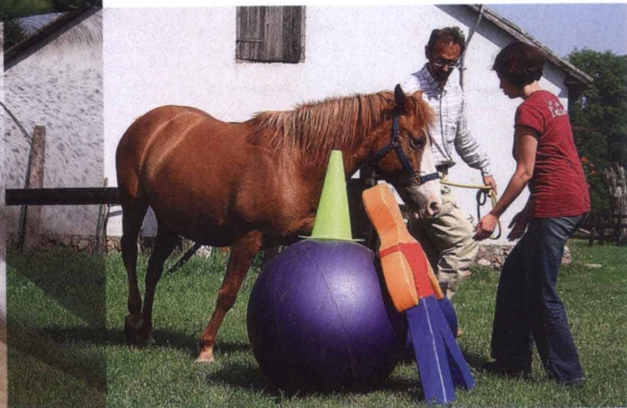
Ćwiczenia oparte na współpracy z koniem są świetnym sposobem, by uczyć budowania relacji

Te zwierzęta robią to, co chcemy, tylko jeśli mają do nas zaufanie