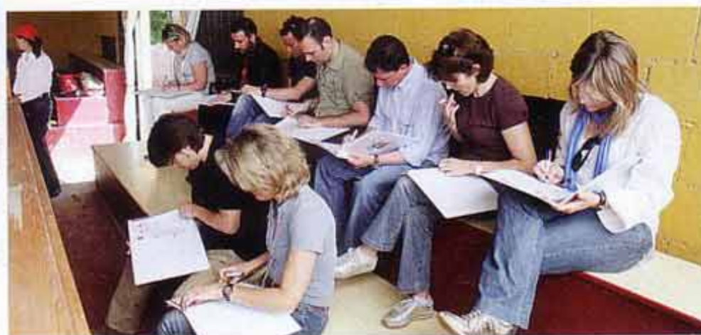
Caballos y Liderazgo Natural es una empresa pionera en España en coaching con caballos

N o es fácil reconocer ante los demás que uno es inseguro, que no termina de comunicarse fluidamente en el trabajo o en la vida. O al contrario, que no escucha por cierta prepotencia